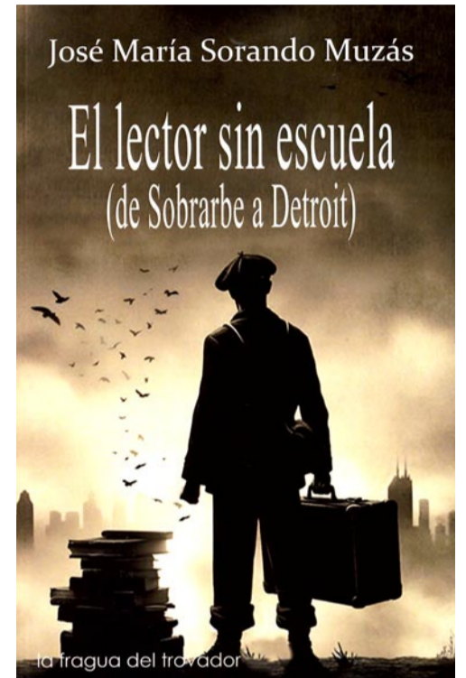
'El lector sin escuela'

fascinación ante los rascacielos; las colonias españolas en torno a la siderurgia del Medio Oeste; las minas de carbón de Kentucky donde acechaba la muerte; la cadena de montaje del Ford modelo T en Detroit; el gansterismo durante la Ley Seca; las miserias de la guerra y de la posguerra españolas; el estraperlo de antibióticos; el valor de la escuela rural; y más. En todas partes, el amor a los libros le ofreció un refugio ante la dureza de la vida real y la revelación de la vida posible".