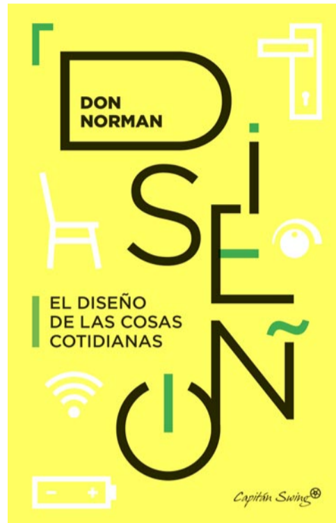
'El diseño de las cosas cotidianas'