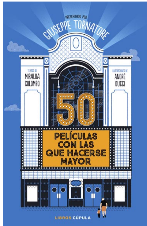
'50 películas con las que hacerse mayor'

"Conoció los oficios más duros; el contrabando con Francia; las multitudes de emigrantes europeos que embarcaban buscando una vida mejor; la isla de Ellis, puerta de entrada a Nueva York y también 'isla de las lágrimas'; la